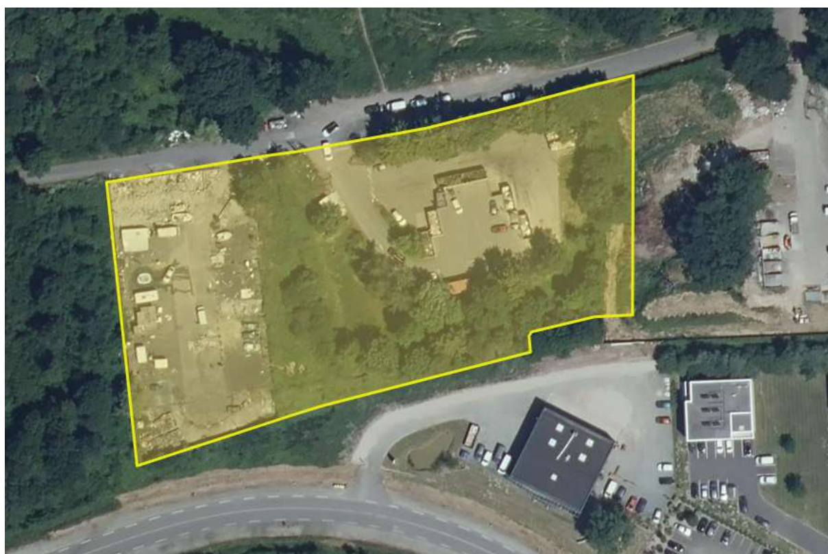
Figure 1 : Parcelles du projet de reconstruction de la déchetterie

Les parcelles d'emprise du projet correspondent aux parcelles 13,14,15, 16 et 369 section AL de la commune de La Montagne. Le site de la future déchetterie constitue un ensemble de parcelles cadastrales représentant 10 240 m 2 . Nantes Métropole est propriétaire des parcelles.